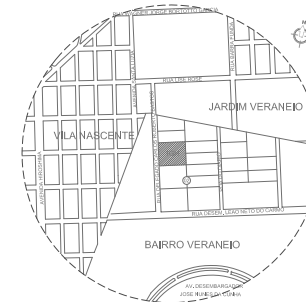
02 PLANTA DE LOCALIZAÇÃO ESCALA 1:10.000